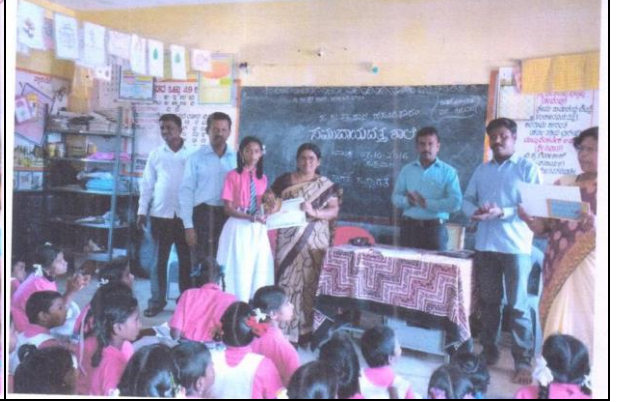
ಶಾಲೆ ಬಿಟ್ಟು ಮಕ್ಕಳ ಸಮೀಕ್ಷೆ ಕಾರ್ಯ